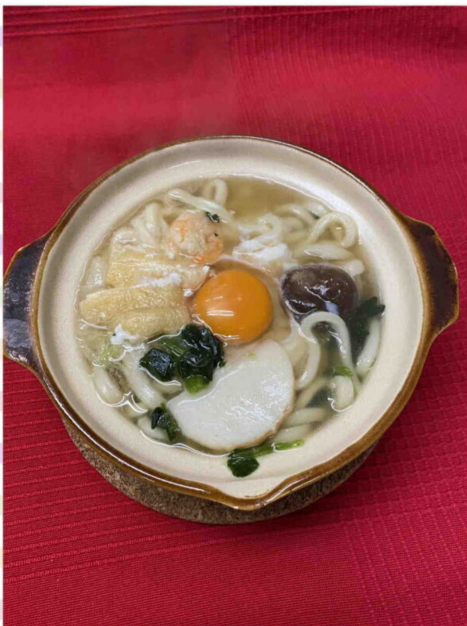
鍋焼きうどん & チゲうどん